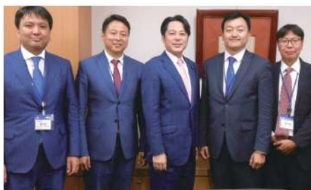
▶モンゴルで新党を立ち上げた政治家達と会談

落合貴之は、多くのみなさまからの負託をいただいたことで、野党側の取りまとめ役である経産委員会野党筆頭理事などにも抜擢。職責を果たすため、国会にとどまらず、日本中、そして世界中を駆けまわります。