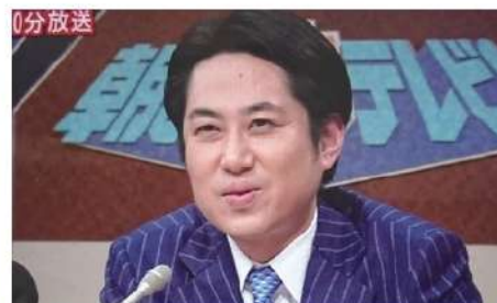
▶報道番組や討論番組にも続々出演