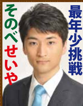
維新の党 世田谷区 政策委員