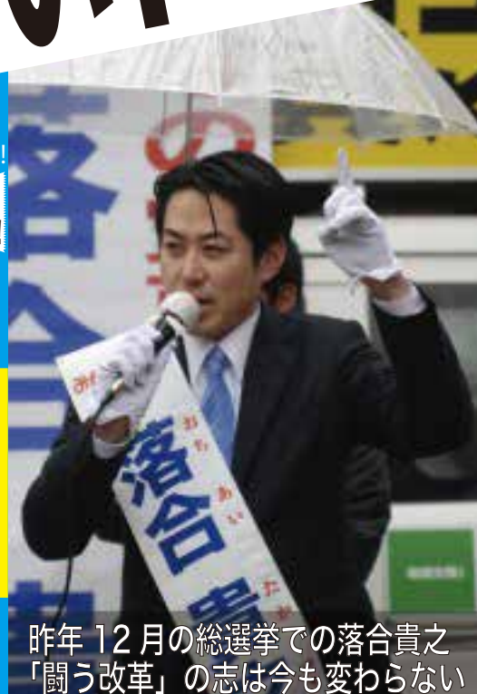
昨年12月の総選挙での落合貴之「闘う改革」の志は今も変わらない